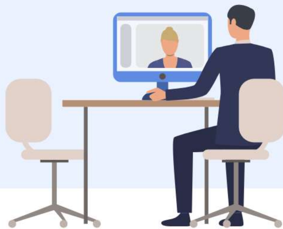
carrusel De imágenes

El equipo de tus sucursales no solo atiende a los clientes de forma presencial sino que también podrá atender a otros de forma remota.